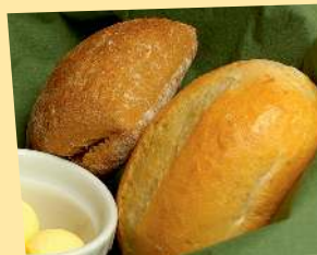
Булочки с маслом Plain buns, butter on the side 80 rub