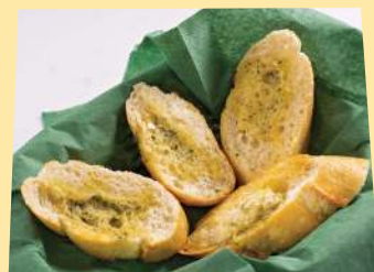
Половина багета 1/2 Baguette 80 rub