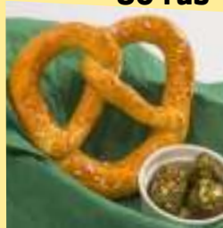
Брецель с маслом Pretzel, butter on the side 120 rub