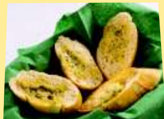
Булочки с маслом Plain buns, butter on the side 80 rub